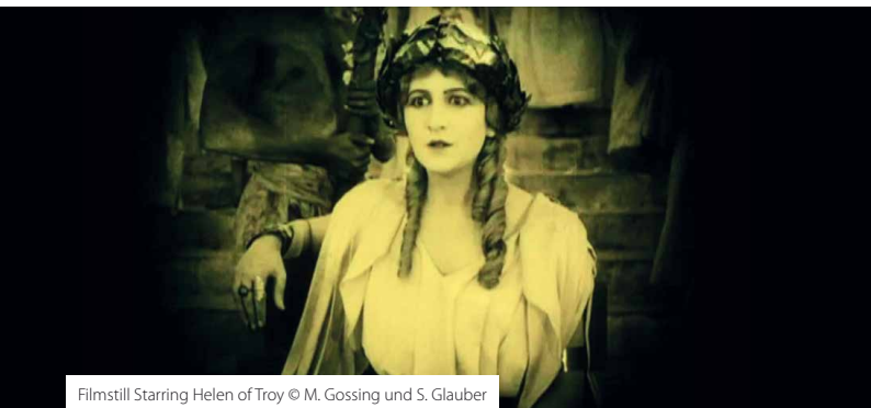
Filmstill Starring Helen of Troy